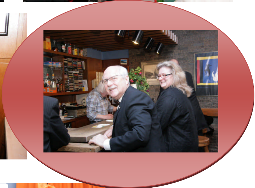
Gute Witze kommen immer an